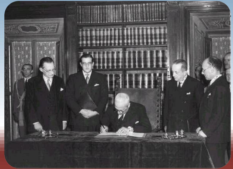
Enrico de Nicola firma la costituzione

Come scrive Norberto Bobbio la nostra Costituzione è frutto di un "compromesso storico" che è stato possibile perché i costituenti avevano tutti in comune l'idea di una democrazia intesa come un'insieme di principi, di regole, di istituzioni che permettono la più ampia partecipazione di cittadini alla cosa pubblica.